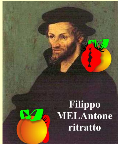
Filippo MELAntone ritratto

Attenzione: NON GIRARE QUESTO NUMERO: dall'altra parte sa di MERDA!!!