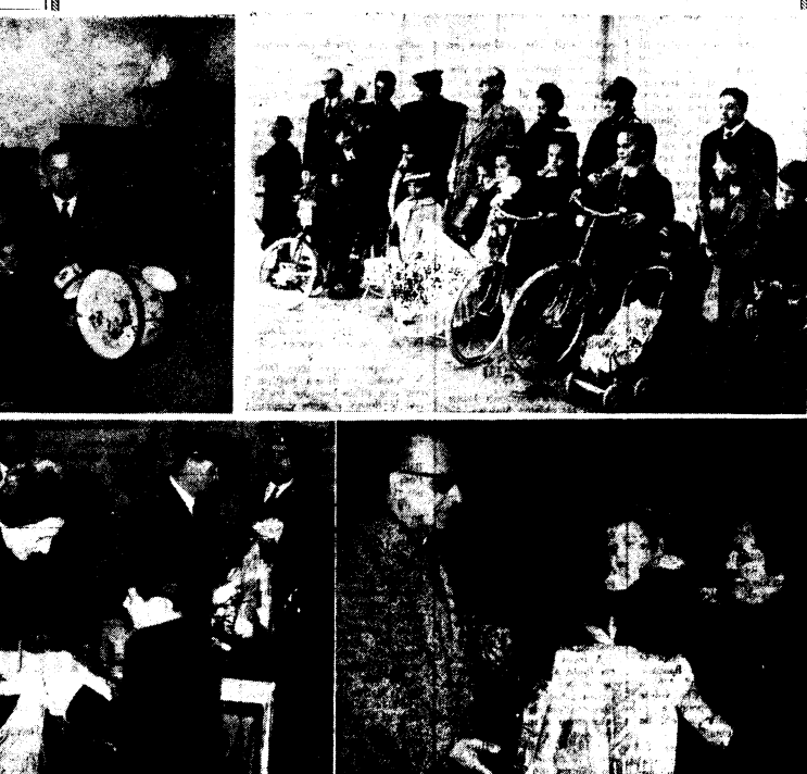
LA BEFANA CHE HA SVISLA NEL CORSO DI PUBLIICHE MANIFESTAZIONI CHE PER ALTRO HANNO IL MERTO DI SOFFRIBRE SCILIMENTI DI RECIPROCO AFFETTO E DI SOLIDARIETA UMANA.